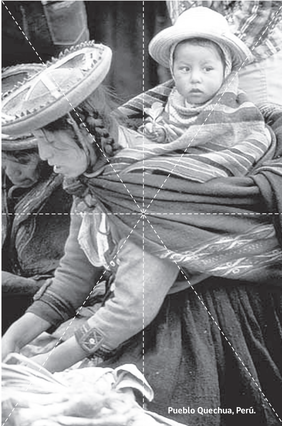
Pueblo Quechua, Perú.

Arma tu rompecabezas patrimonial. Recorta la imagen de la ficha, pégala en un cartón y luego recorta por las líneas punteadas.