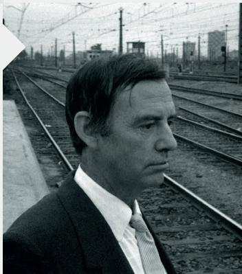
Blanca Varela (1926-2009)

Explora sobre este poeta chileno en el sitio web que le dedica Memoria Chilena: https://bit.ly/2pTfM6N