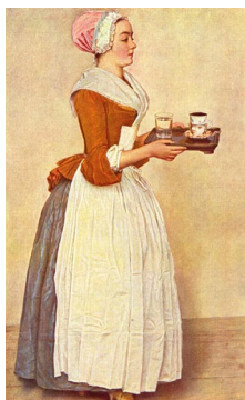
La bella chocolatera. Jean Étienne Liotard. Lápiz pastel. 1744.

La obra realiza un recorrido por la sociedad chilena durante diferentes períodos históricos a través de Mama Rosa , quien trabaja en una casa patronal. La relación que establece con los demás personajes la convierte en testigo de la dinámica amo-sirviente, consolidada a comienzos de siglo a partir de una estructura social terrateniente basada en la diferenciación social.