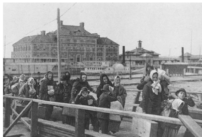
Inmigrantes entrando a los Estados Unidos a través de la Isla Ellis. Autor desconocido. 1902.

Actualmente, a nivel mundial existe un alto porcentaje de emigración, proveniente principalmente de países con altos niveles de pobreza. Es muy común que estos inmigrantes se trasladen a naciones con economías desarrolladas, donde terminan en su mayoría trabajando en el servicio doméstico.