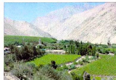
Vista panorámica Montegrande