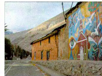
Vista panorámica de la Ruta D-485