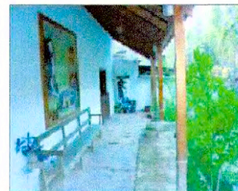
Vista corredor de Casa Escuela Rural de Montegrande