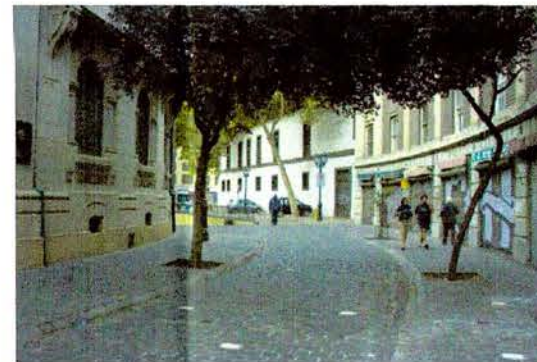
Vista calle Londres hacia el norte.