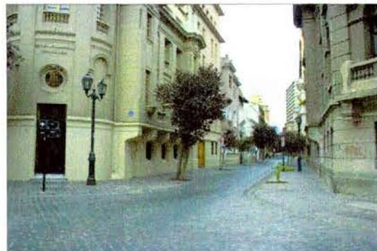
Vista de Calle Paris hacia el oriente.