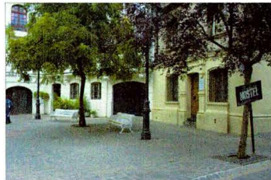
Vista parcial Plaza José Toribio Medina.