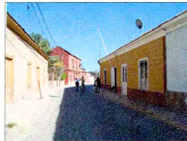
Vista calle Principal