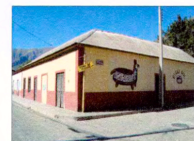
Vista esquina de calle Principal y calle Los Perales

NOTAS: Plano elaborado en el Consejo de Monumentos Nacionales en base a: • Levantamiento topográfico, estudio+arquitectura+patrimonio, diciembre 2009. • Las cotas prevalecen por sobre el dibujo, son aproximadas y están expresadas en metros. En caso de fondos de predio, estos prevalecen por sobre la cota. (* Esta información no acredita propiedad)