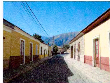
Vista calle Principal