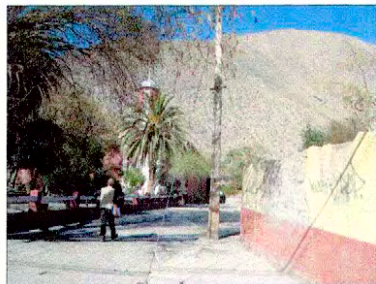
Iglesia y plaza del Pueblo de Diaguitas