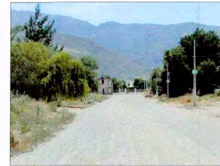
AV. PRINCIPAL DE LA HACIENDA