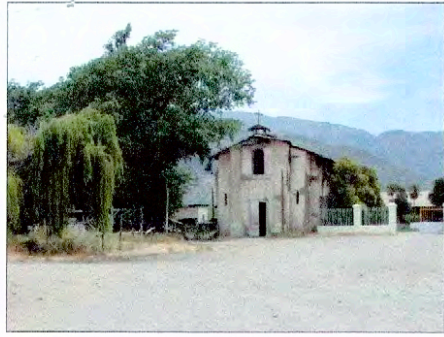
CAPILLA LO VICUÑA