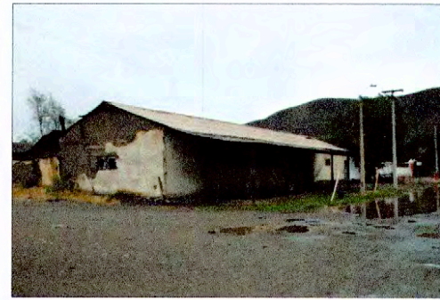
CASA DE INQUILINOS