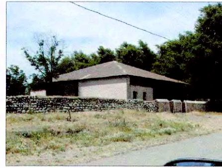
CASA DE INQUILINOS