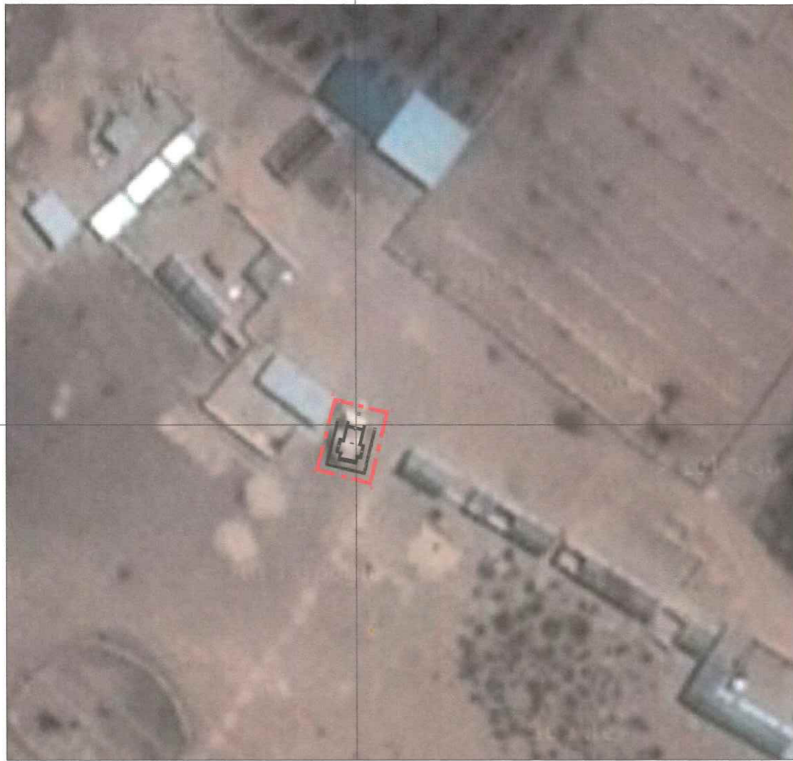
PLANO DE UBICACIÓN ESCALA GRÁFICA