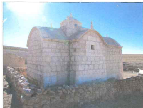
Vista suroriente de la iglesia.