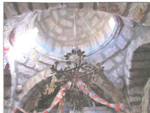
Vistade la cúpula central de la iglesia.