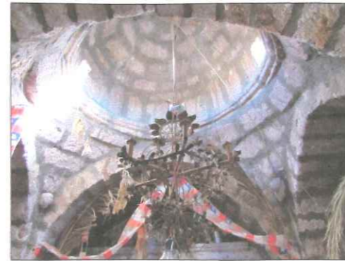
Vistade la cúpula central de la iglesia.