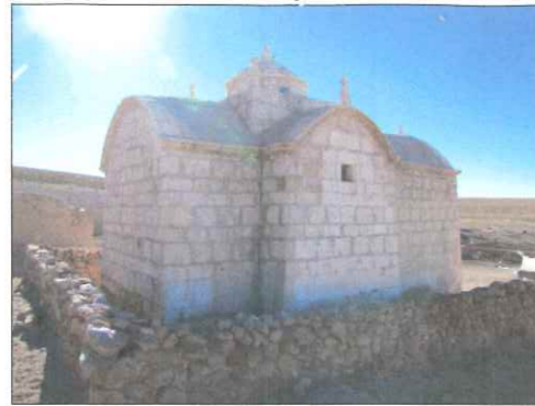
Vista suroriente de la iglesia.