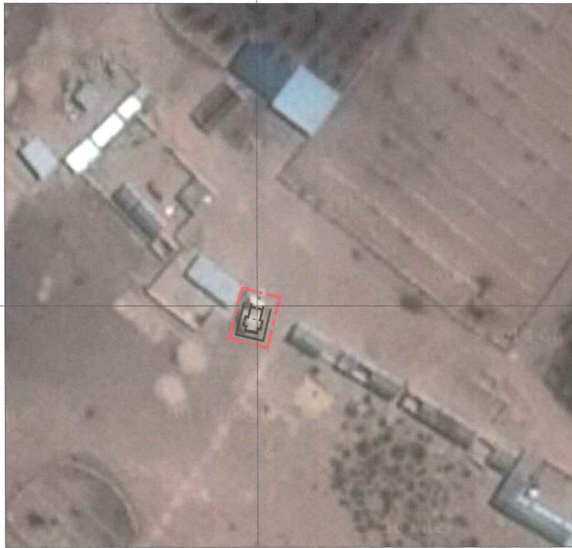
PLANO DE UBICACIÓN ESCALA GRÁFICA 0 10 20 30 40 m