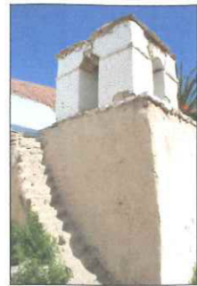
Vista del campanario.