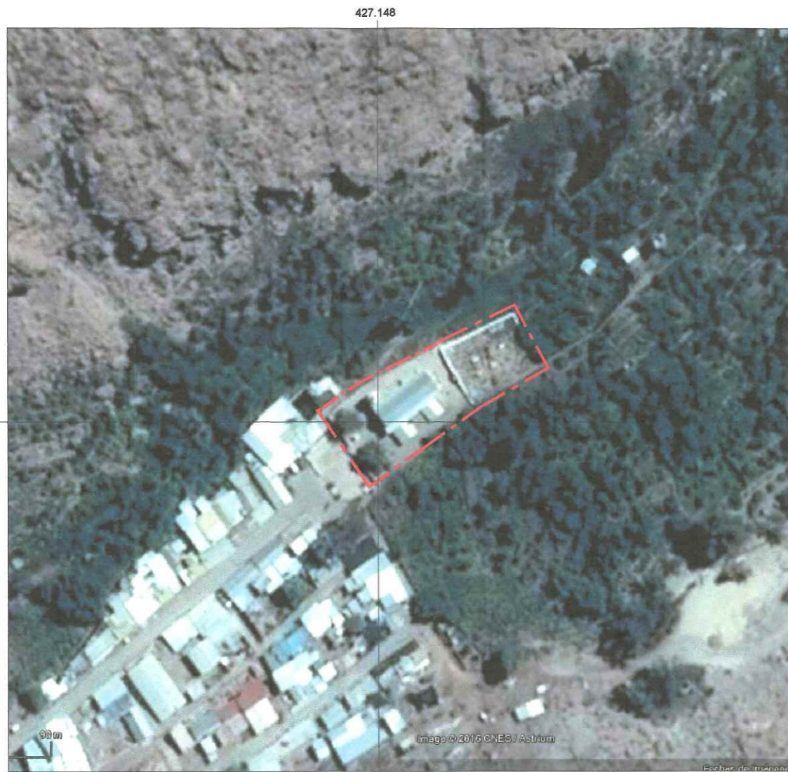
PLANO DE UBICACIÓN ESCALA GRÁFICA 0 25 50 75 100 m