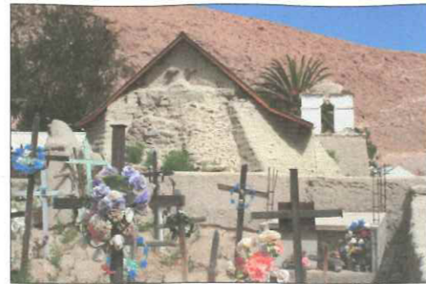
Vista del cementerio e Iglesia.