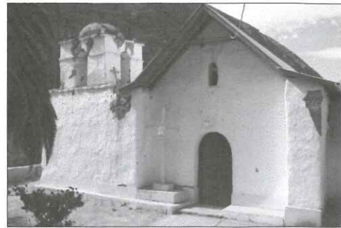
Vista de la fachada de la Iglesia.