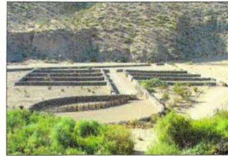
Vista panorámica del corral de veranada. 351.000