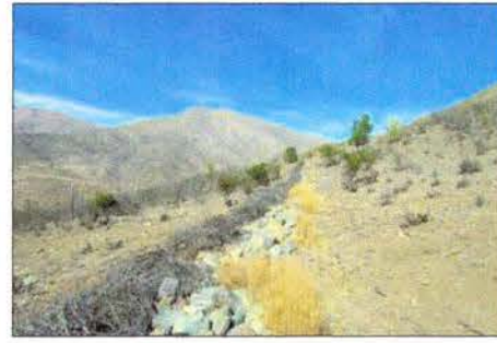
Vista del límite norponiente del corral de invernada. 351.500