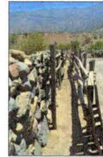
Vista del corral.