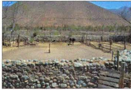
Vista del corral de veranada. 350.500