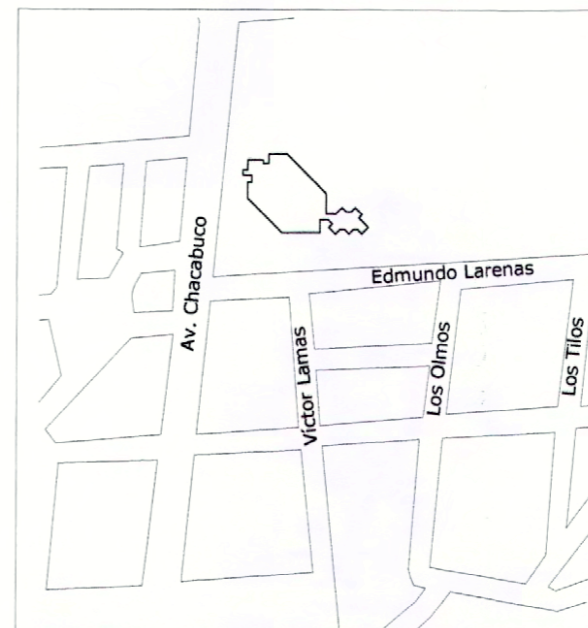
PLANO DE UBICACIÓN SIN ESCALA

CONTENIDO: PLANO DE LIMITES PLANO DE UBICACIÓN FOTOGRAFÍAS Escala: Gráfica Lámina: 1 de 1 Fecha: 19.12.2008