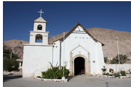
Vista a Iglesia San Martín de Tours de Codpa