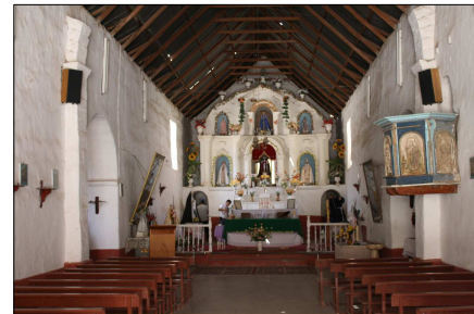
Vista interior a Iglesia San Martín de Tours de Codpa