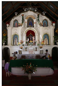
Vista interior a Iglesia San Martín de Tours de Codpa