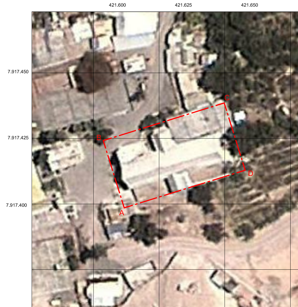
PLANO DE UBICACIÓN ESCALA GRÁFICA

NOTAS: Plano elaborado en el Consejo de Monumentos Nacionales en base a: • Levantamiento Arquitectónico y levantamiento GPS Datum WGS 84, Huso 19 S, mes febrero de 2015. Realizado por Fundación Altiplano Monseñor Salas Valdés. • Base de información: Estudio Diagnóstico de Declaratoria MN Iglesia san Martín de Tours de Codpa, profesionales a cargo: Cristián Heinsen, Ronald Caicedo, Marta Piech, Claudio Bertín y Alejandra Palacios.