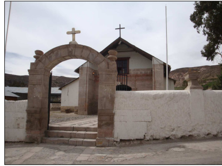
Vistas de Iglesia San Idelfonso de Putre