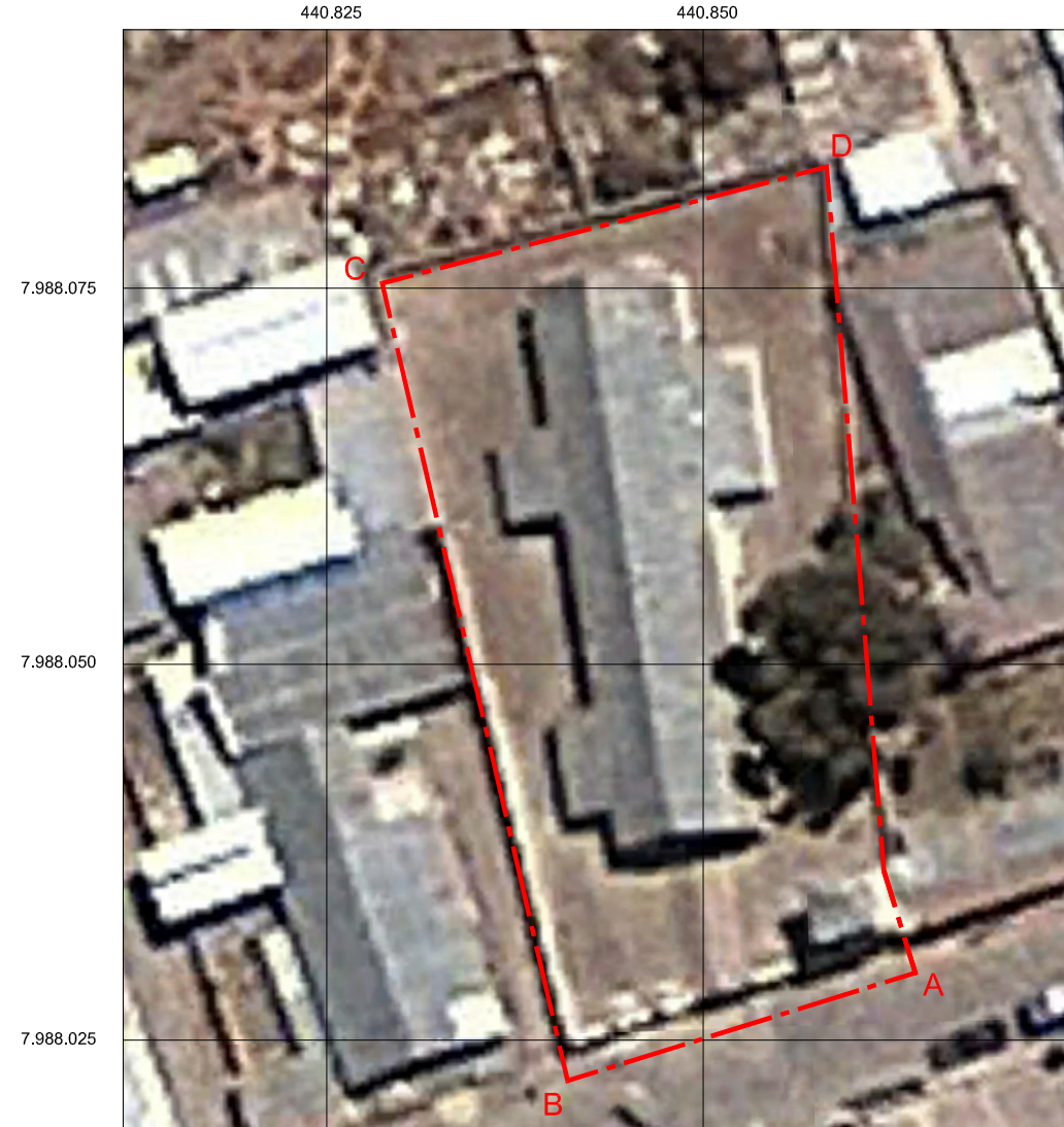
PLANO DE UBICACIÓN ESCALA GRÁFICA