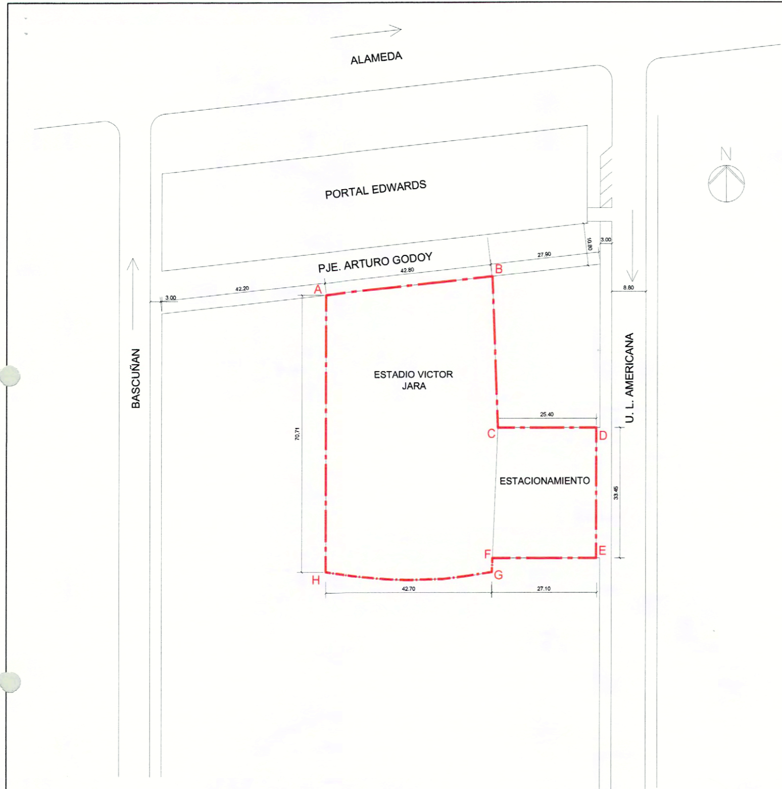
PLANO DE LÍMITES Y PLANO DE UBICACIÓN