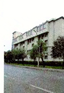
Vista por calle Santa María de la Facultad de Derecho