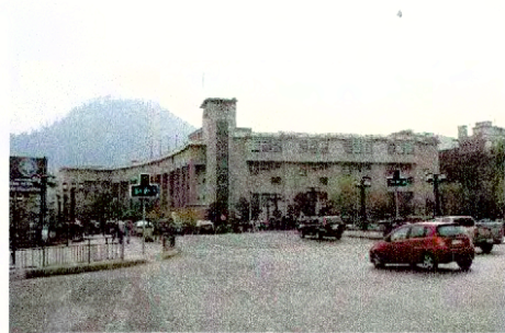
Vista por calle Pío Nono de la Facultad de Derecho