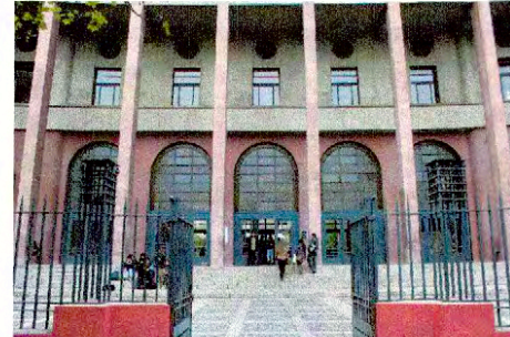
Fachada principal de la Facultad de Derecho