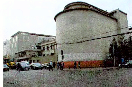
Vista por calle Bellavista de la Facultad de Derecho