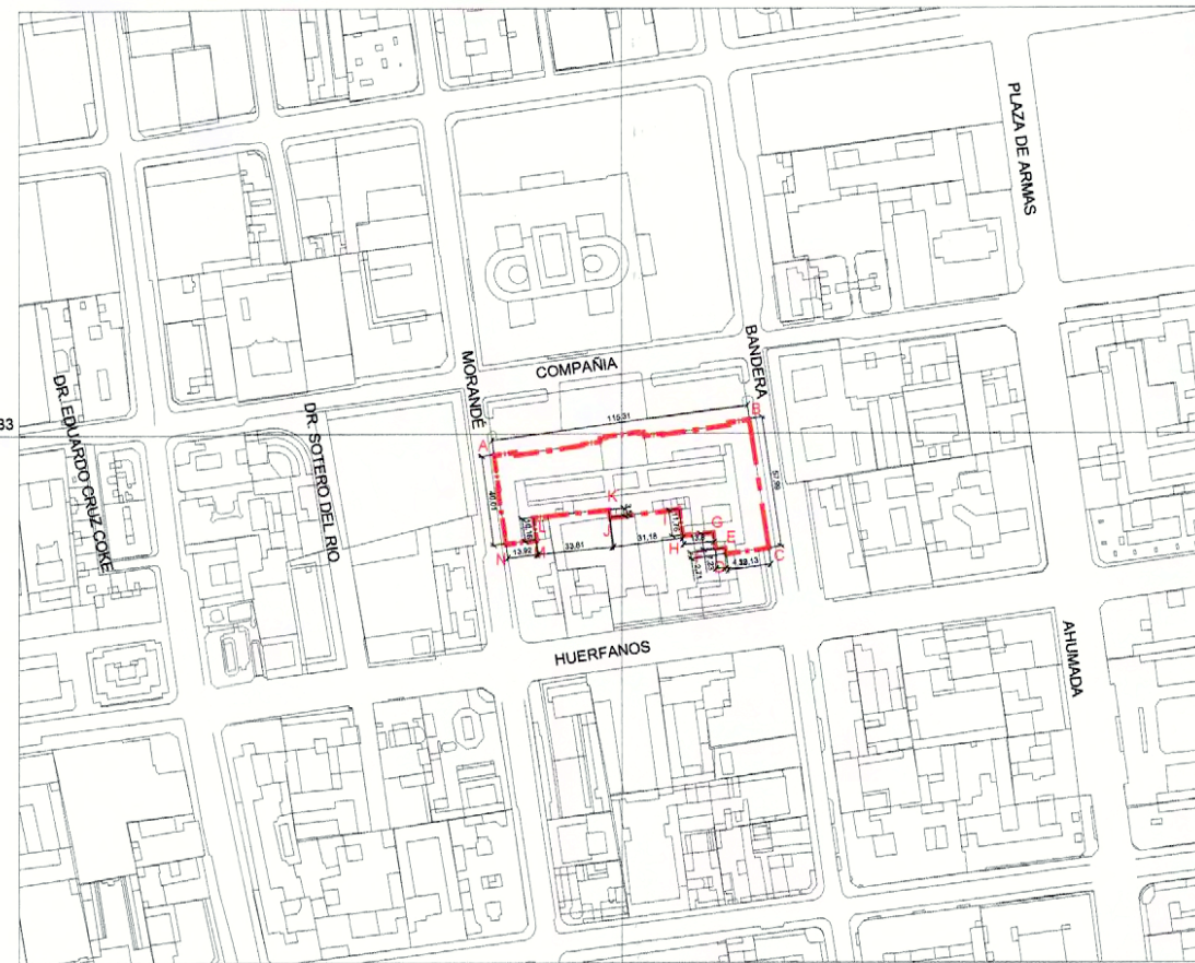
PLANO DE LÍMITES ESCALA GRÁFICA