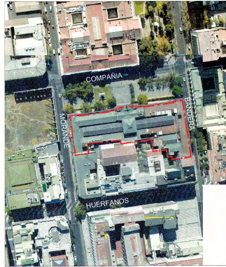
PLANO DE UBICACIÓN SIN ESCALA