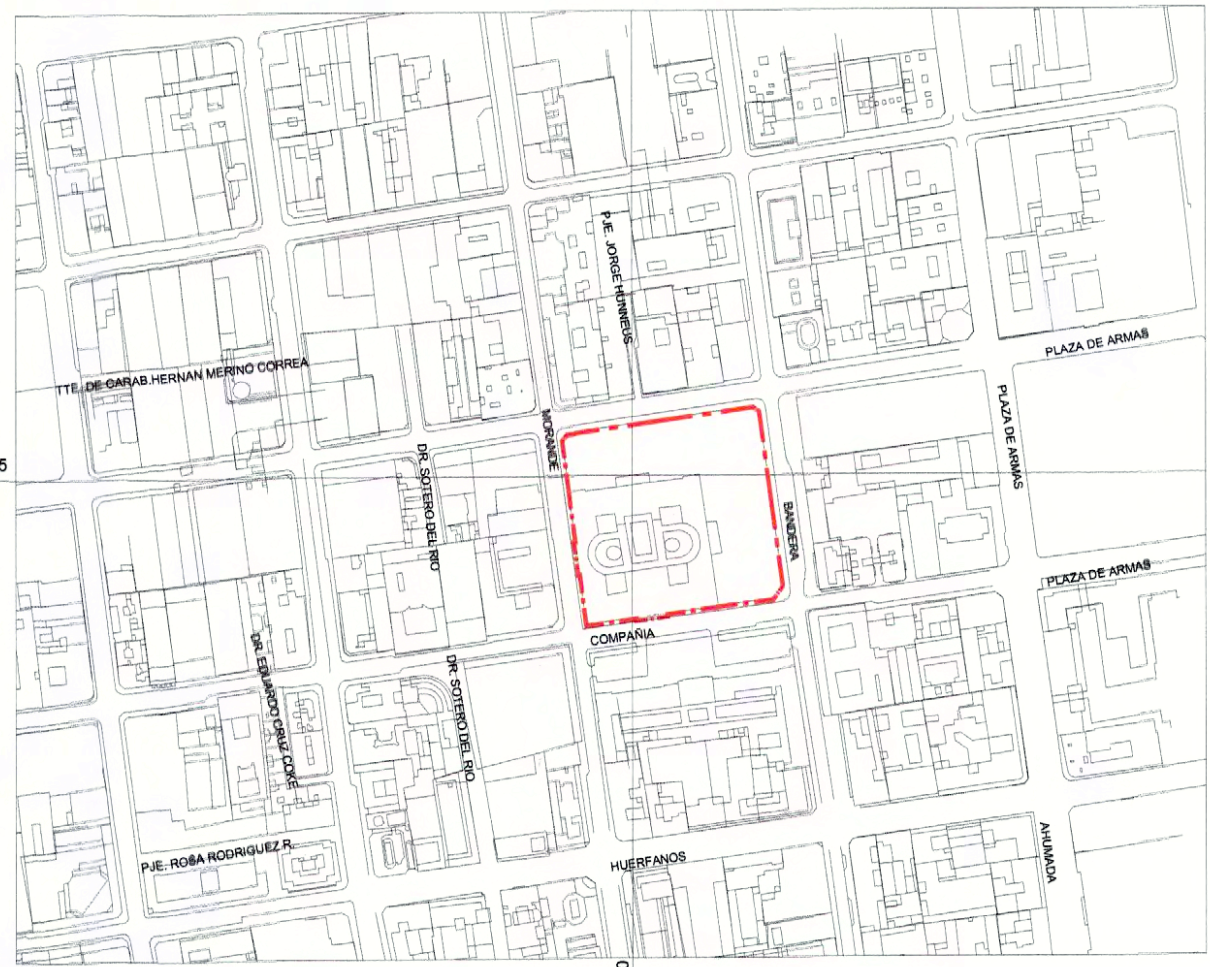
PLANO DE UBICACIÓN ESCALA GRÁFICA 0 50 100 150 200 m