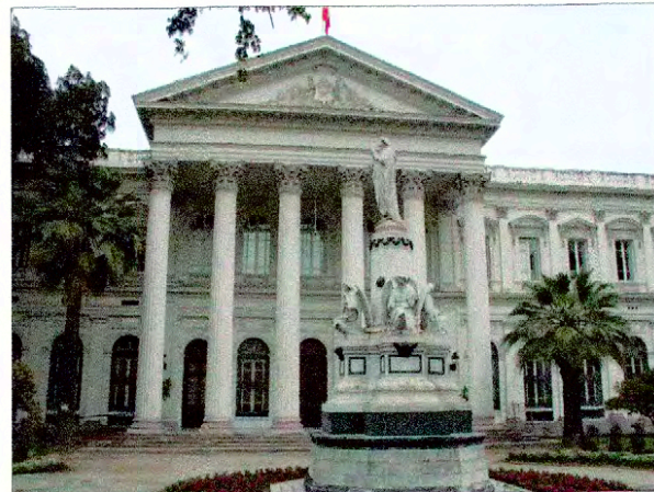
Vista fachada por calle Catedral