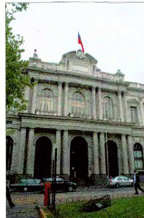
Vista fachada por calle Compañía