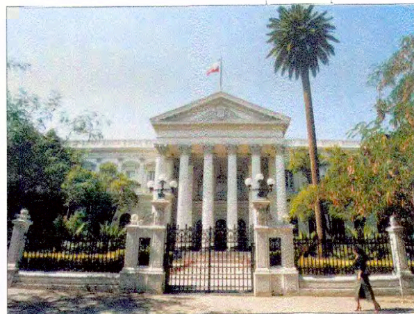
Vista fachada por calle Bandera