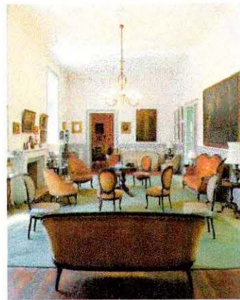
Fotografía del interior de uno de los salones.