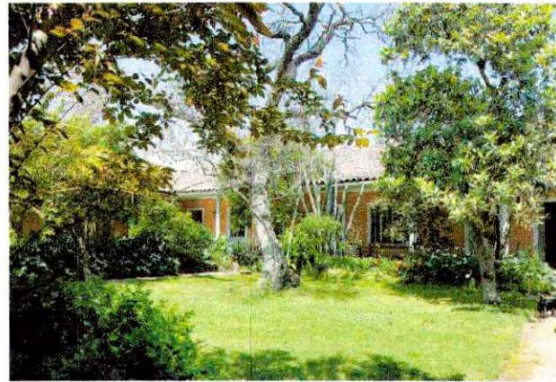
Fotografía patio interior.