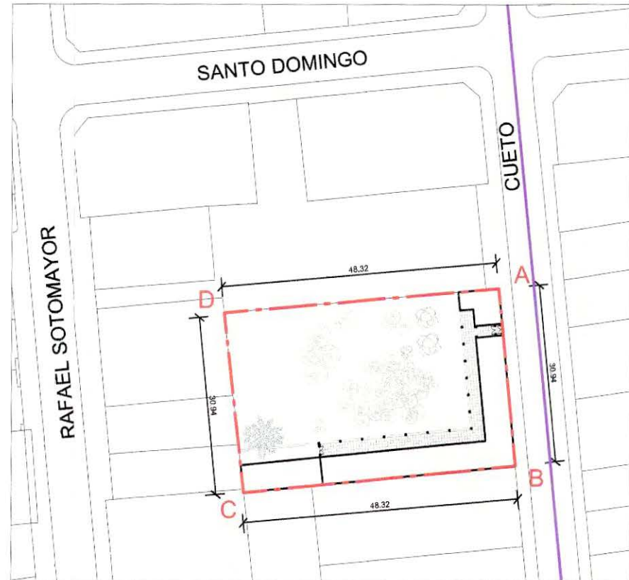
PLANO DE LÍMITES ESCALA GRÁFICA 0 10 20 30 40 m

NOTAS: Plano elaborado en el Consejo de Monumentos Nacionales en base a: • Base catastral I. Municipalidad de Santiago, 2007. • Proceso de georreferenciación de acuerdo a la información desarrollada por la UIT del Área de Gestión de la Información y Estudios - CMN. Estándares: WGS 84, H19 S. • Las cotas prevalecen por sobre el dibujo, son aproximadas y están expresadas en metros. En caso de fondos de predio, estos prevalecen por sobre la cota. • Esquicio de Chile: "Autoriza su circulación, por Resolución N°475 del 22 de octubre de 2014 de la Dirección Nacional de Fronteras y Límites del Estado". • Fotografías gentileza "El Mercurio". (*) Esta información no acredita propiedad.