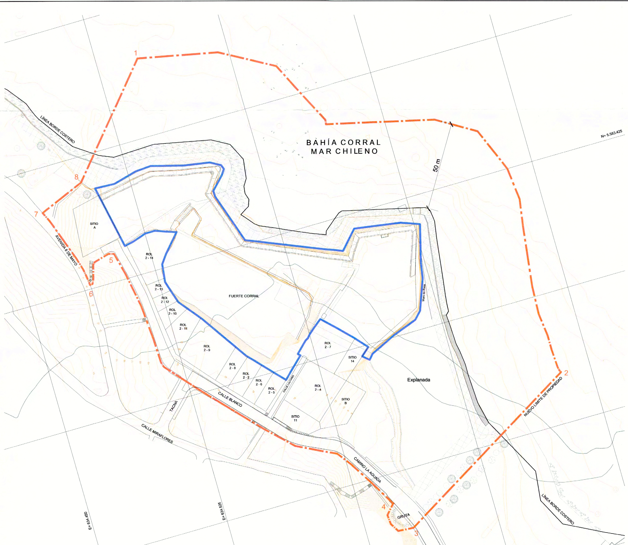
PLANO DE LÍMITES Escala Gráfica