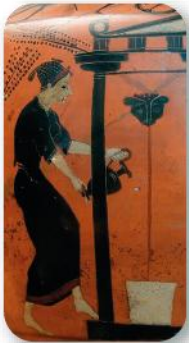
Fragmento ánfora: muestra una mujer.

A pesar de la dificultad que representa hacer un estudio demográfico, algunos historiadores han calculado en 40.000 el número de ciudadanos, incluidos esposas e hijos, para la Atenas de esta época, sobre una población algo mayor de 300.000 habitantes. Aunque había ricos, la mayoría eran pequeños propietarios de tierras, jornaleros y artesanos.