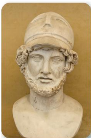
Busto en mármol. Copia romana de original griego.

El “siglo de Oro” ateniense coincidió... con la figura de Pericles, que rigió como primer magistrado durante varios años, a partir del 461 a. C., los destinos de la polis . A él se le considera el culminador de la democracia ateniense al eliminar las prerrogativas que aún tenía el Areópago , principal reducto de los nobles, en beneficio de la Ecclesia y la Boulé , al permitir la posibilidad de que un mayor número de grupos sociales pudieran acceder a las altas magistraturas, y al instaurar el sistema de la mistoforia o pago de dietas a los ciudadanos que ejercieran como jurados o fueran miembros del consejo: la paga era de dos óbolos diarios, suma modesta, pero que permitía que todos, los más humildes, pudieran ejercer sus derechos políticos, aunque se quedaran sin el jornal diario de su trabajo.