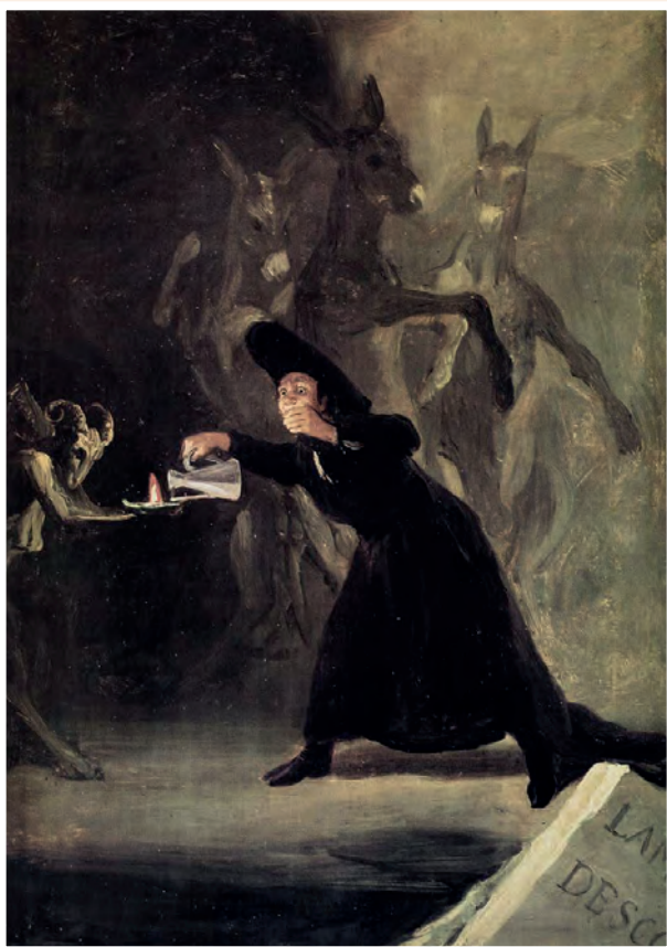
▲ Francisco de Goya: El hechizado por la fuerza , 1798.