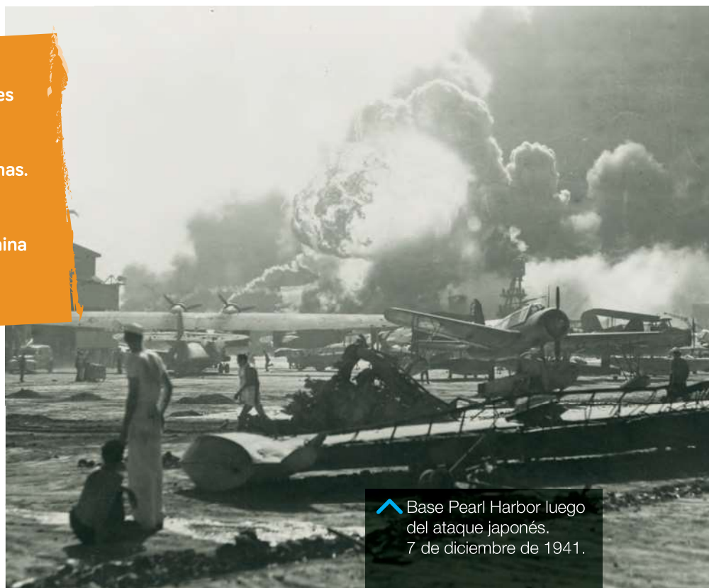
Base Pearl Harbor luego del ataque japonés. 7 de diciembre de 1941.