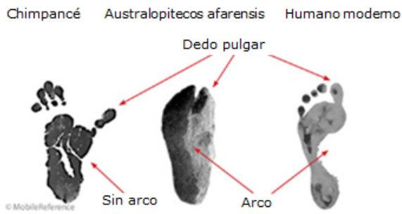
Imagen B: Huellas de pisadas