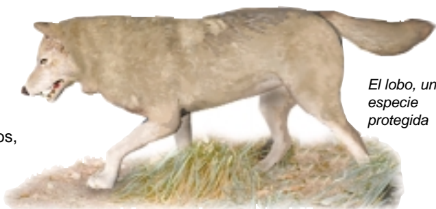
El lobo, una especie protegida

En las zonas frías del país viven marmotas, ardillas de tierra, truchas comunes, osos, morsas, focas de piel, caribúes y alces. En los bosques del Este habitan osos negros, ciervos, zorros, mapaches, mofetas, ardillas y pájaros pequeños. Los pelícanos, los flamencos, los martines pescadores verdes, los caimanes americanos, los peces gato y las serpientes venenosas se encuentran a lo largo de la costa del golfo de México. Las praderas acogen conejos, perrillos de las praderas y turones de pies negros, mientras que en las montañas occidentales conviven los alces americanos, los muflones de las rocas, las cabras montesas, los lobos grises y los osos pardos. El bisonte sobrevive en cautividad o en áreas protegidas.