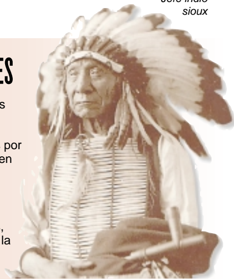
Jefe indio sioux

Los amerindios seminómadas ocupaban el territorio de los actuales Estados Unidos y lucharon contra los europeos por la posesión de estas tierras, en un proceso que pasó por la victoria de los pueblos de las llanuras (entre los que se encontraban los hidatsas, sioux, pies negros, cheyenes, comanches o arapahoos) en la batalla de Little Big Horn (1876) y que culminó en Wounded Knee con la masacre de los sioux por el ejército en el año 1890.