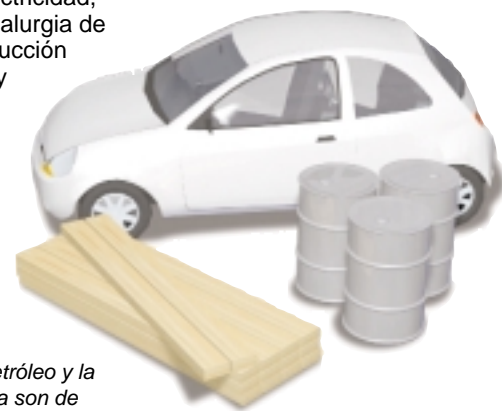
La fabricación de automóviles, el petróleo y la industria maderera son de los sectores más importantes

El sector de los servicios ocupa más de dos tercios de la actividad económica, la industria representa una cuarta parte y la agricultura sólo supone algo más del 2%.