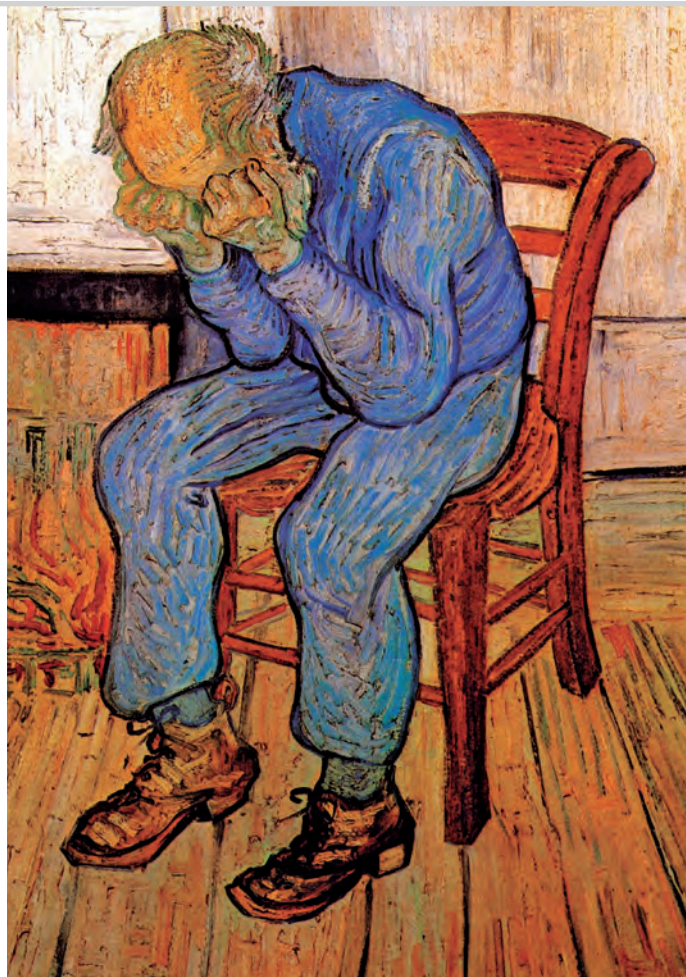
Vincent van Gogh, En el umbral de la eternidad , 1890. ▶

1. Para comenzar, observa la siguiente imagen y describe en un breve texto lo que interpretas de ella. Para ello, imagina quién es la persona que aparece, cómo es su vida, qué está pensando y por qué está en ese lugar. Usa en tu descripción la palabra devenir. Busca su significado en el diccionario si lo necesitas.