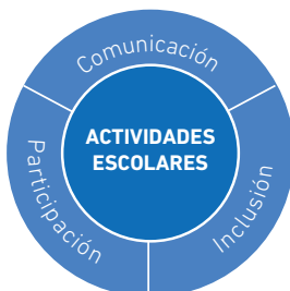
Figura 2. Pilares de gestión de actividades de la Escuela Claudio Arrau