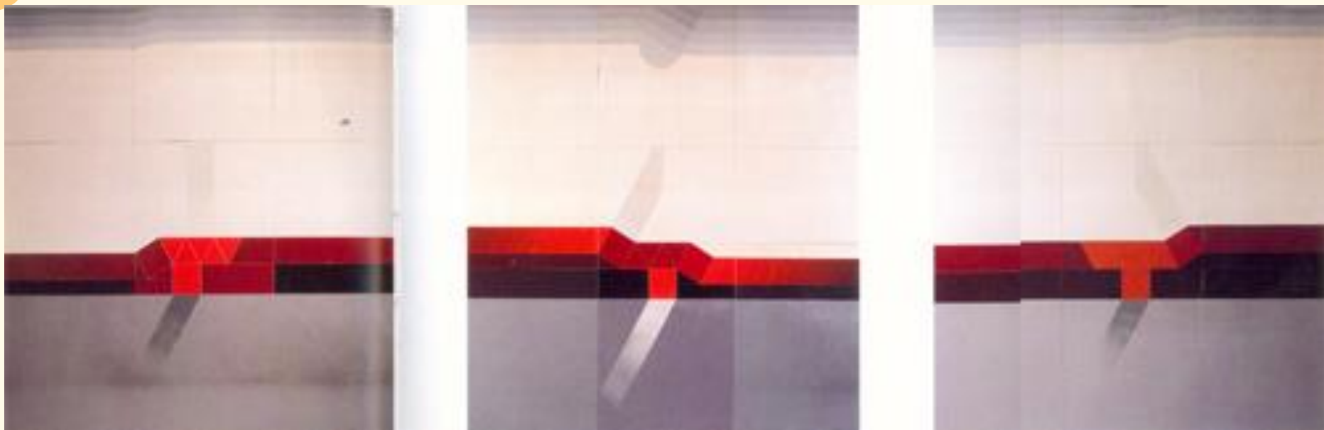
Hombre y mujer trabajadores, Carlos Ortúzar