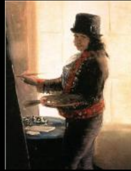
Marie Louise Elisabeth Vigée-Lebrun y Francisco Goya