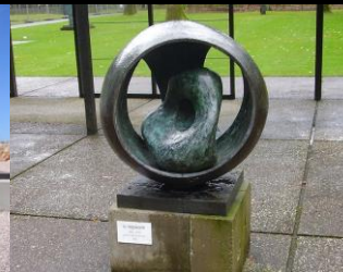
Henry Moore y Bárbara Hepworth