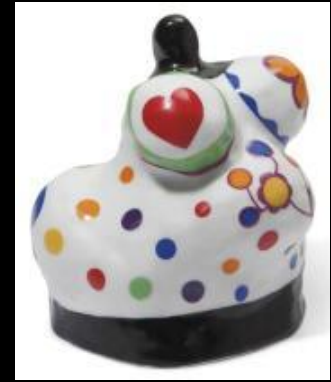
Joan Miró y Niki de Saint Phalle