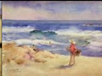
Mary Cassatt y Joaquín Sorolla