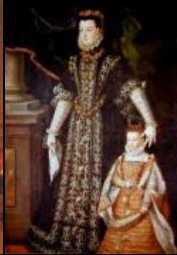
Diego Velázquez y Sofonisba Anguissola