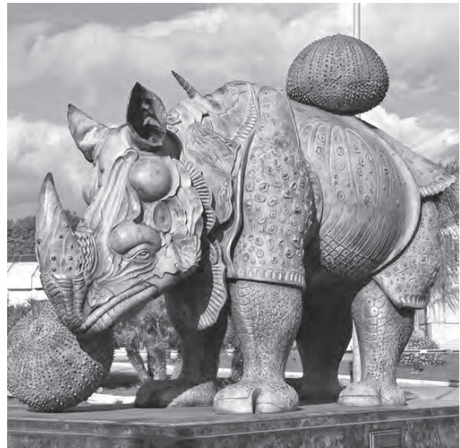
▲ Salvador Dalí, Rinoceronte vestido con puntillas , 1956. Marbella, España.