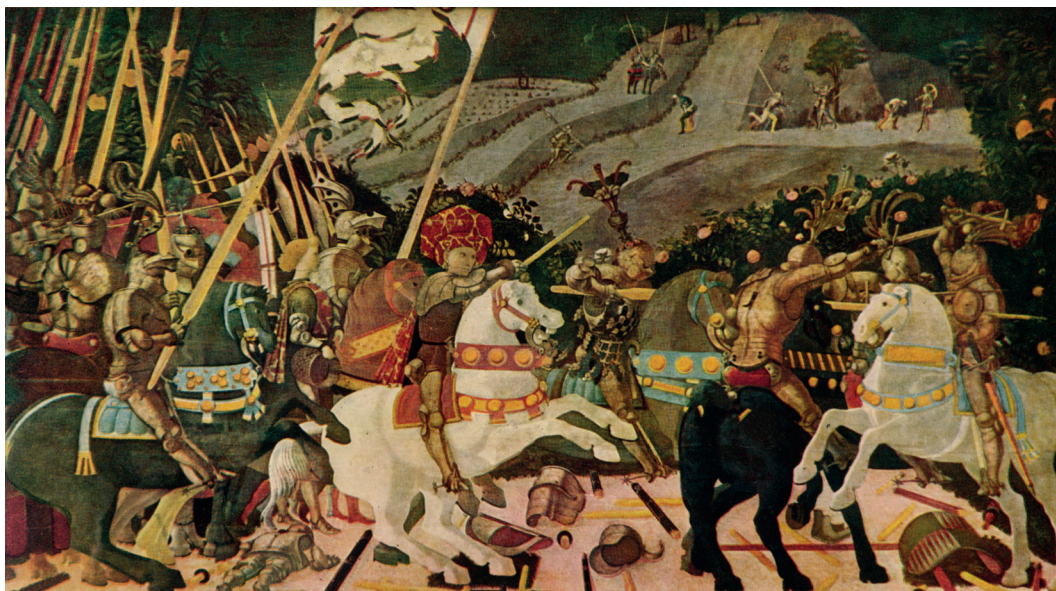
◀ La batalla de San Romano (hacia 1438), del renacentista italiano Paolo Uccello. Londres: Galería Nacional.

Los jinetes del Apocalipsis son figuras representadas en Revelaciones o Apocalipsis , el último libro del Nuevo Testamento, que trata sobre una segunda venida de Jesucristo a la Tierra. Los jinetes, montados en caballos de diferentes colores, simbolizan la victoria, la guerra, el hambre y la muerte.