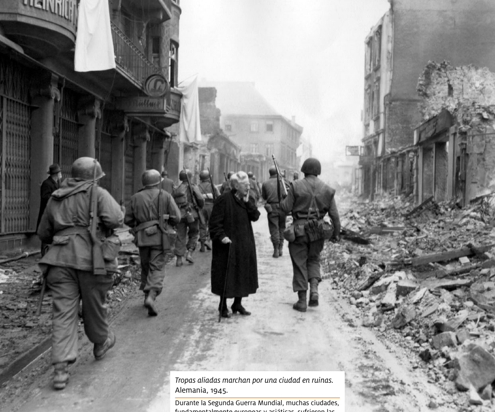
Tropas aliadas marchan por una ciudad en ruinas. Alemania, 1945.

Durante la Segunda Guerra Mundial, muchas ciudades, fundamentalmente europeas y asiáticas, sufrieron las consecuencias de los bombardeos y los combates.