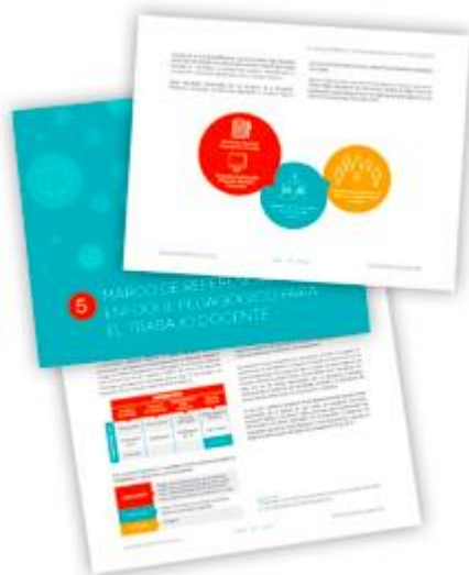
Orientaciones para docentes y directivos