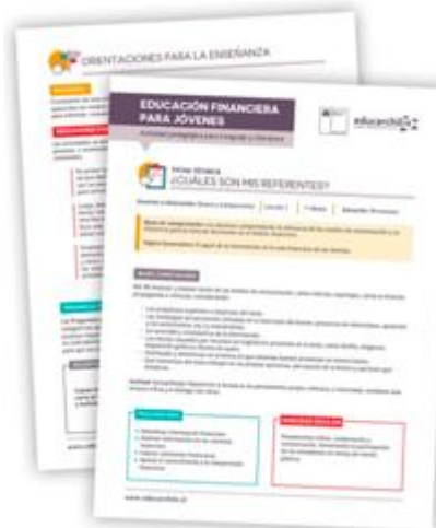
Fichas general para cada dominio y asignaturas y 12 actividades de aprendizaje por asignatura