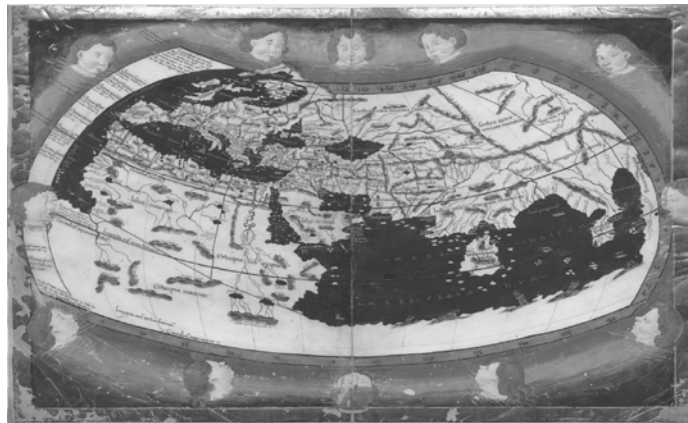
Donnus Nicolaus Germanus, mapa del mundo en la Cosmographia Claudii Ptolomaei Alexandrini , circa 1467.