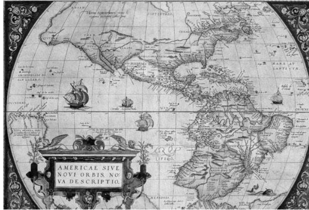
Abraham Ortelius, América Sive Novi Orbis Nova Descriptio , 1573.