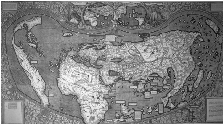
Martín Waldseemüller, Universalis Cosmographia , 1507.