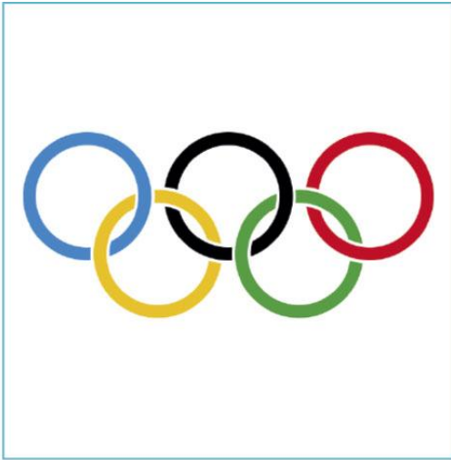
Por Pierre de Coubertin (trazado por Denelson83), via Wikimedia Commons