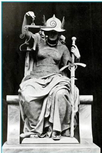
Por Edward Onslow Ford , via Wikimedia Commons