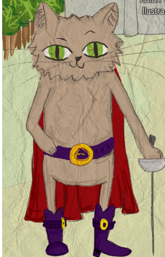
Ilustración: Paula Llao