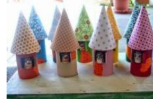
Casas de pájaros