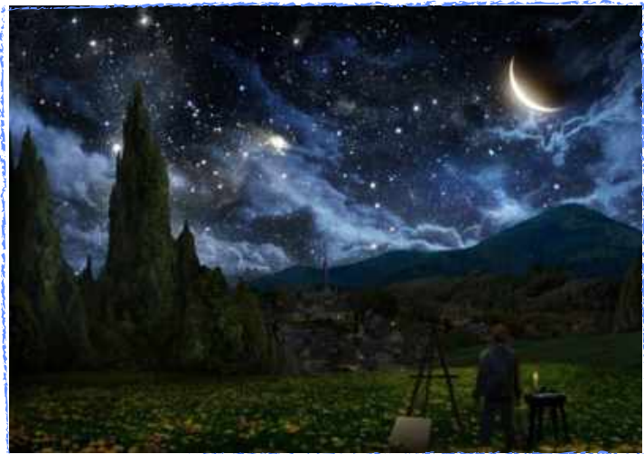
La noche estrellada de Van Gogh reimaginada y realizada digitalmente por Alex Ruiz.

Desde que era un niño, su madre le enseñó a amar y observar la naturaleza con mucha atención para comprender sus misterios: como el sol hacía cambiar el color de las hojas de los árboles durante el día y como las estrellas parecían moverse en el cielo durante la noche.