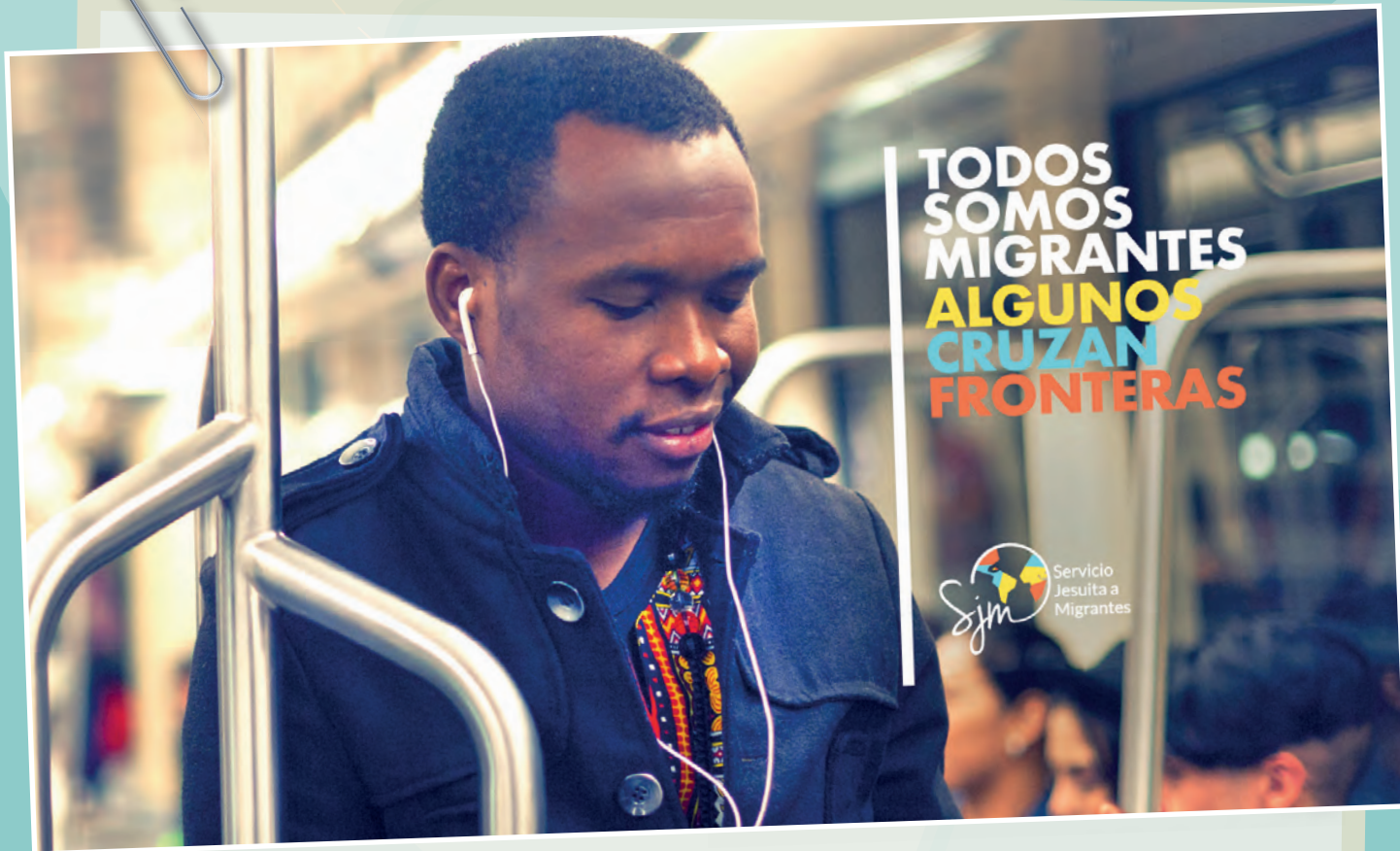
Campaña #TodosSomosMigrantes de la Fundación Servicio Jesuita a Migrantes. Conoce su trabajo en sjmchile.org