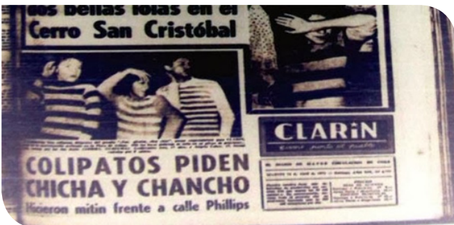
Fuente: Diario el Clarín. 22 de abril de 1973. Chile. Adaptación: Alejandro Rojas, 2013.