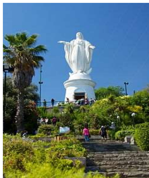
Cerro San Cristóbal (Región Metropolitana)