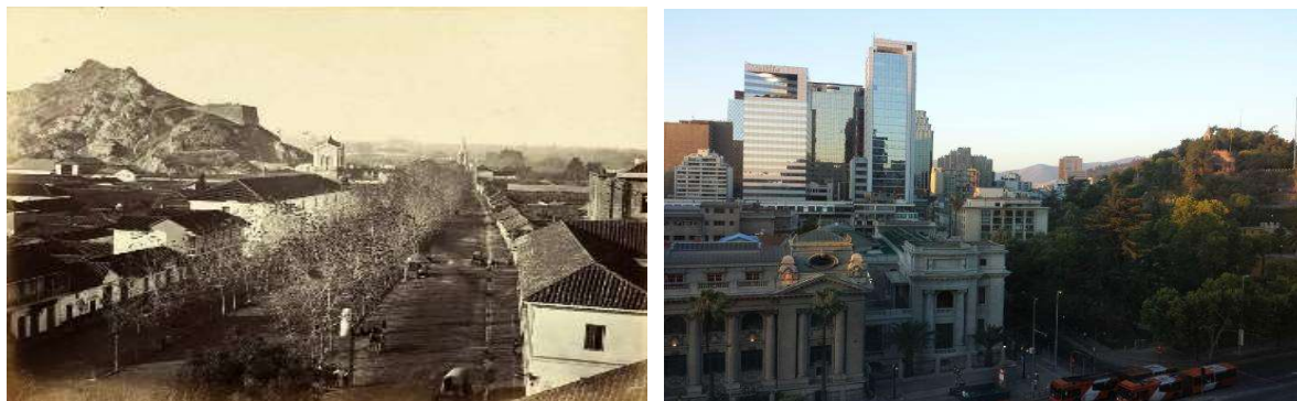
Alameda Libertador Bernardo O'Higgins (Santiago, Región Metropolitana)