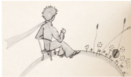
Fig. 1: Ilustración original de Antoine de Saint-Exupéry