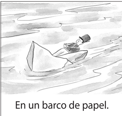
En un barco de papel.