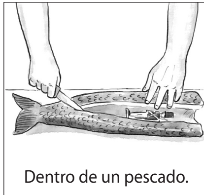
Dentro de un pescado.