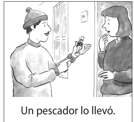
Un pescador lo llevó.

12. Según el cuento, ¿quién hizo un barco de papel?