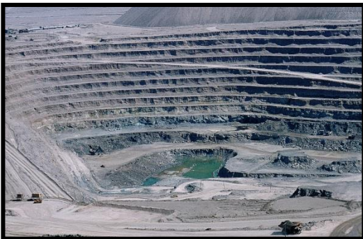
Mina cobre Chuquicamata II región