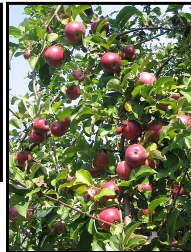
Manzanos VI región