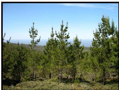
Bosque de Pinos VIII región.

Observe atentamente las siguientes imágenes. Escriba en los recuadros con qué actividad económica se relacionan y dibuje un símbolo representativo.