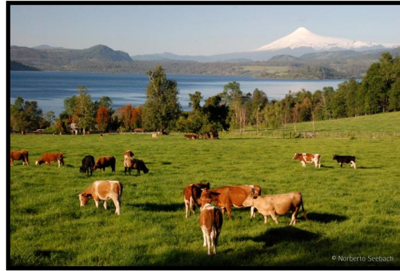
Vacas XIV y X región

¿Con qué actividad económica se relacionan?