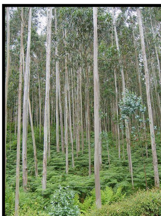
Bosque de Eucalyptus VII región.

¿Con qué actividad económica se relacionan?