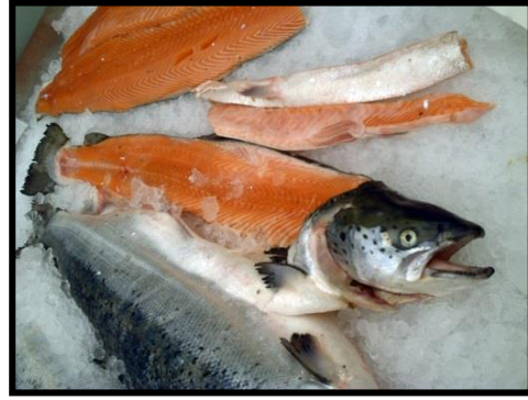
Salmón X región

¿Con qué actividad económica se relacionan?