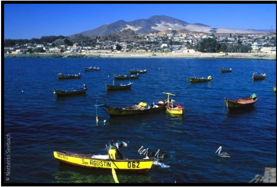
Anchoveta XV a la XIV región (sin RM)