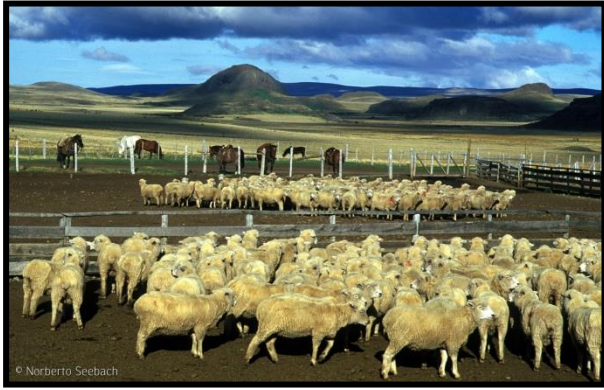
Ovinos XII región