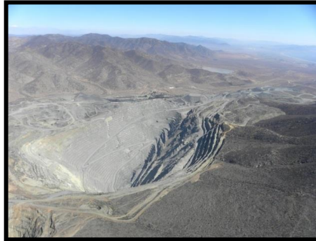
Mina hierro el Romeral III región

¿Con qué actividad económica se relacionan?