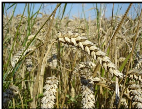
Trigo IX y XIV región