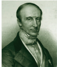
AUGUSTIN CAUCHY (1789-1857)

Cauchy realizó una extraordinaria labor para sistematizar el concepto de función. Pero no es el único.