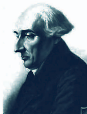
JOSEPH-LOUIS LAGRANGE (1736-1813)

Lo primero que hemos de tener en cuenta es que la ciencia estudia los fenómenos que cambian, o si se quiere, los cambios que sufren los fenómenos. Aquello que es inmutable se puede definir, pero sin cambio no hay análisis. Sin embargo, los procesos del Universo, de la materia o de la energía que varían, en general con el transcurso del tiempo, son los que preocupan a los científicos. Y para estudiarlos se asignan a cada momento o a cada estado el valor de la magnitud que se estudia.