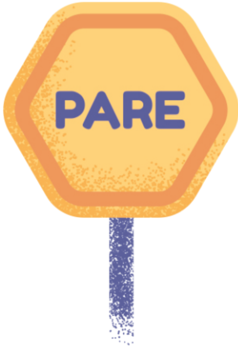
SEÑAL DISCO PARE