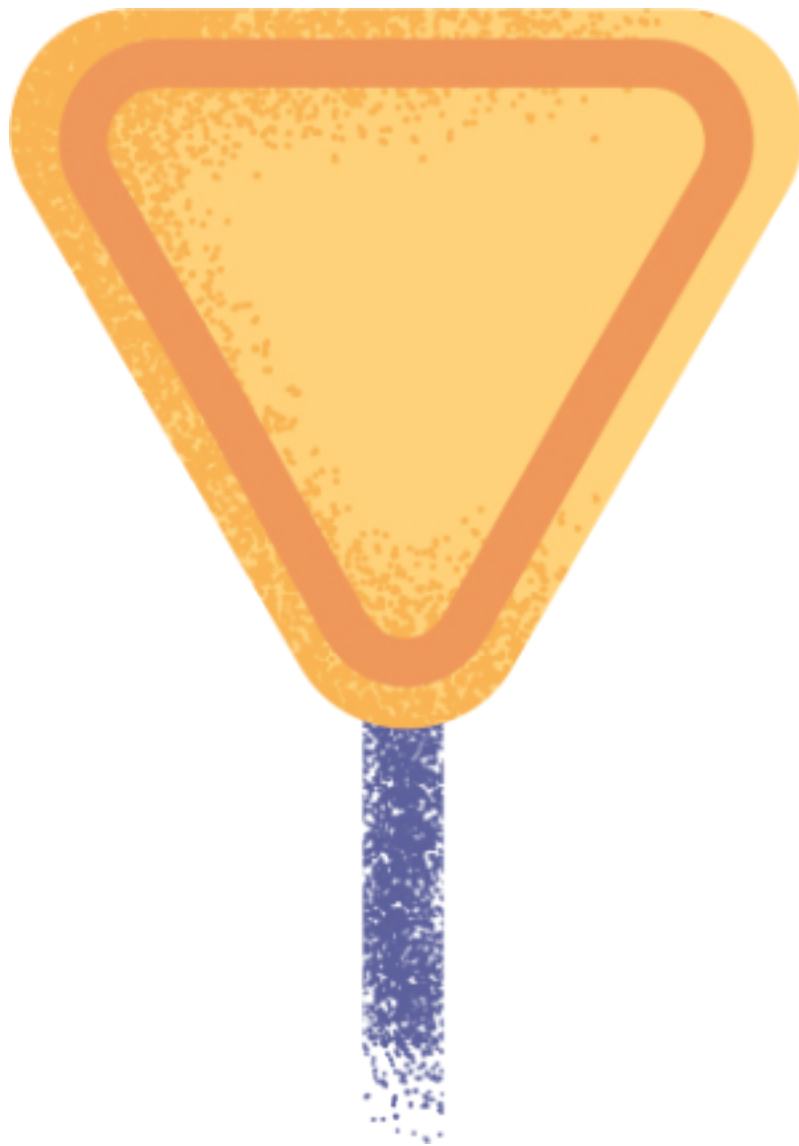
SEÑAL CEDA EL PASO