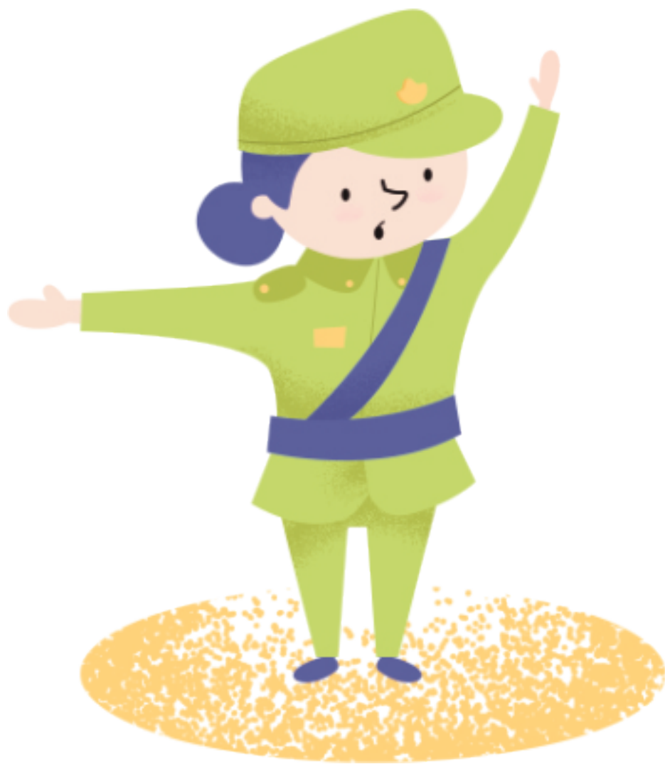
CARABINERA DIRIGIENDO EL TRÁNSITO